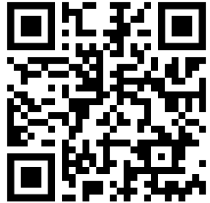
Õpetusvideo rakendusega BMW Connected

Ootame sinu tagasisidet BMW ConnectedDrive'i infoliinile, et saaksime oma tarkvara kauguuendust järjepidevalt optimeerida.